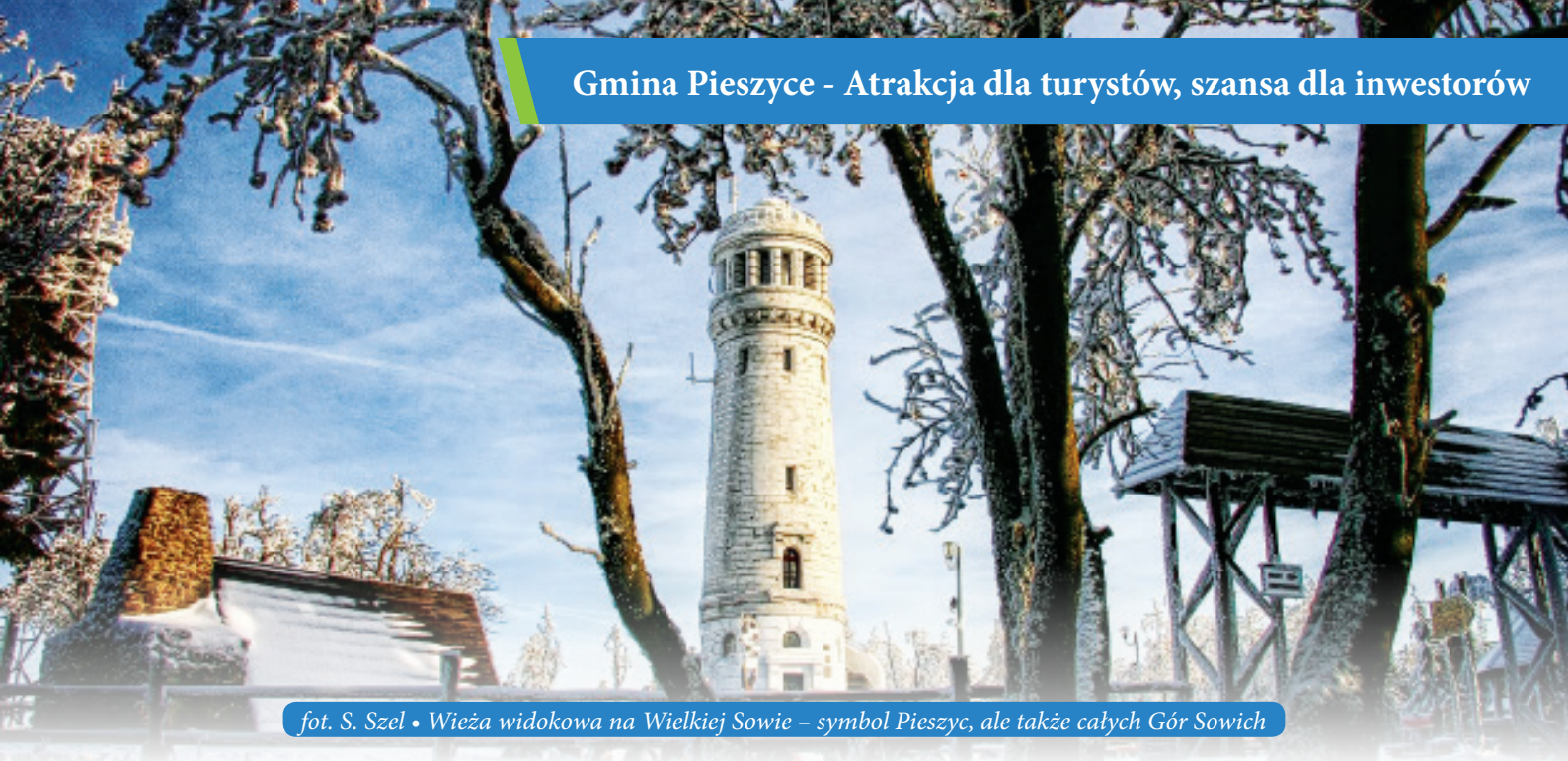
Wieża widokowa na Wielkiej Sowie – symbol Pieszyce, ale także całych Gór Sowich