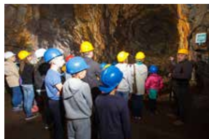
Przez dziesięciolecia możliwość podziwiania ogromu pracy włożonej w drążenie kilometrowych tuneli mieli tylko śmiałkowie