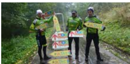
Trasy ACTIV dedykowane są dla rowerzystów, biegaczy i chodźców, a w tym i miłośnikom nordic-walking