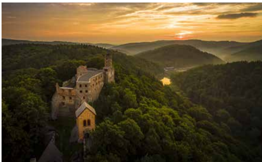
Zamek Grodno.