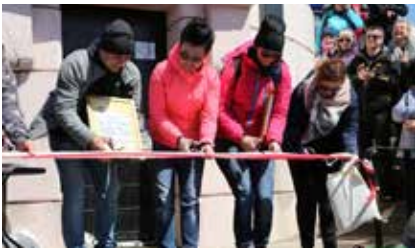
Otwarcie sezonu turystycznego na Wielkiej Sowie