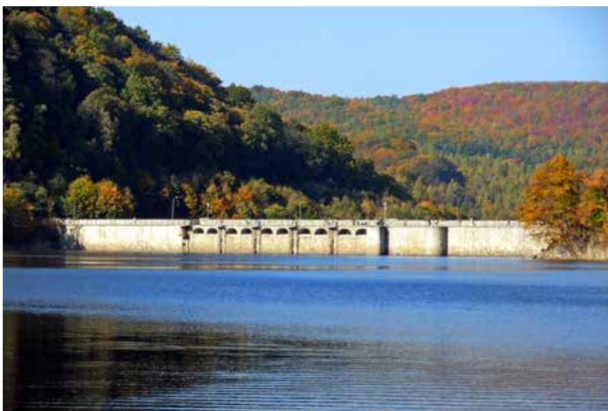
Jezioro Bystrzyckie wraz z zaporą wodną

Walorem Gminy Walim jest górski klimat oraz krajobraz, a także duże różnice terenu, pozwalające doświadczyć nie tylko niezapomnianych widoków, ale dające także ogrom możliwości do aktywnego spędzenia czasu. Od pieszych spacerów na specjalnie wyznaczonych i oznakowanych trasach, po górskie, doskonale przygotowane trasy rowerowe, zróżnicowane pod względem długości i skali trudności. Nawet zimą nasze góry mają wiele do zaoferowania, bowiem poza baśniowymi widokami, zachęcają do korzystania z „białego szaleństwa” na trasach