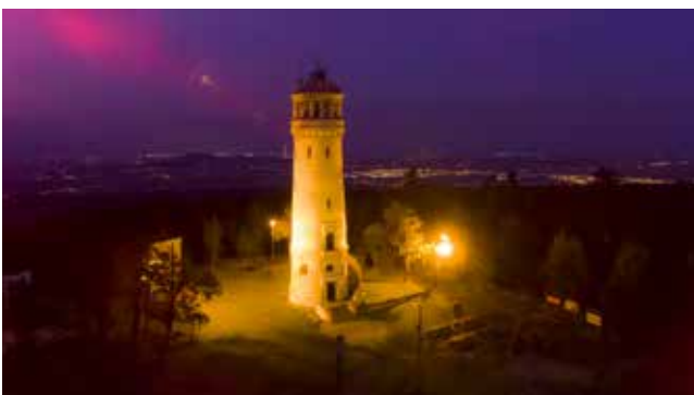
Wieża widokowa na Wielkiej Sowie

Zwolennicy kolarstwa górskiego swoich sił mogą spróbować w Grand Prix Pieszyce MTB Wielka Sowa. Podczas, gdy zawodnicy mierzą się z trudnościami trasy, w miasteczku