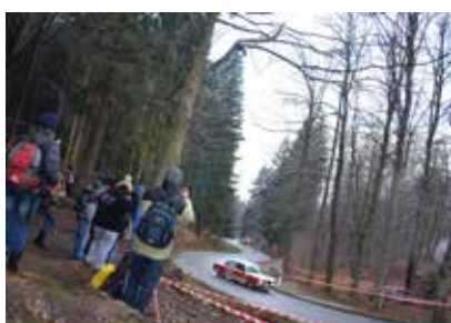
Konkurs samochodowy - Walimska Zimówka