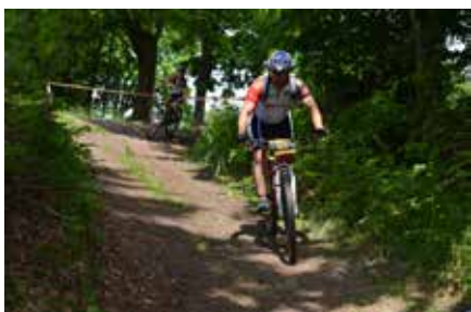
Na terenie Gminy Walim utworzono ok. 70 km doskonale przygotowanych oraz zróżnicowanych pod względem długości i skali trudności górskich tras rowerowych