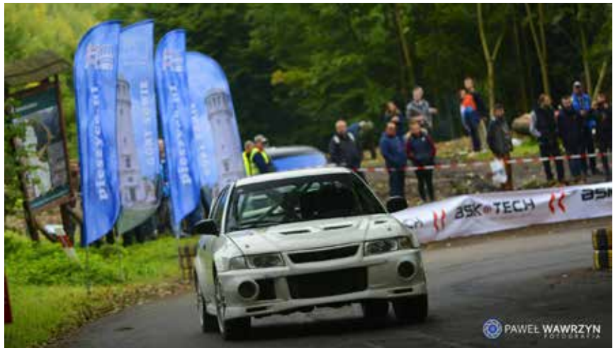
Wyścig Górski w Rościszowie

Rajd Gór Sowich i Wyścig Górski w Rościszowie to z kolei coś dla sympatyków czterech kółek. Bielawska Grupa Motosport wspólnie z Gminą Pieszyce podtrzymują rajdową tradycję regionu, jednocześnie dając możliwość amatorom ścigania się po najbardziej kultowych odcinkach rajdowych w Polsce.