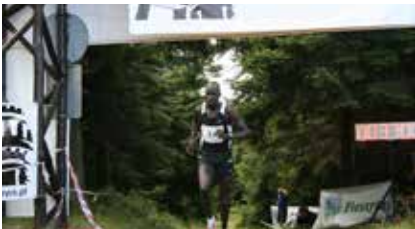
Bieg górski na Wielką Sowę