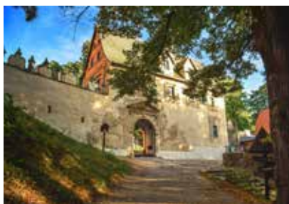
Przekrocz bramę piastowskiego Zamku Grodno i poznaj cząstkę tego niezwykłego świata.