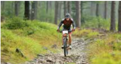
MTB Wielka Sowa

zawodów na kibiców czekają zapierające dech w piersiach pokazy rowerowe oraz atrakcje dla dzieci, które również mogą rywalizować na specjalnie przygotowanym torze rowerowym.