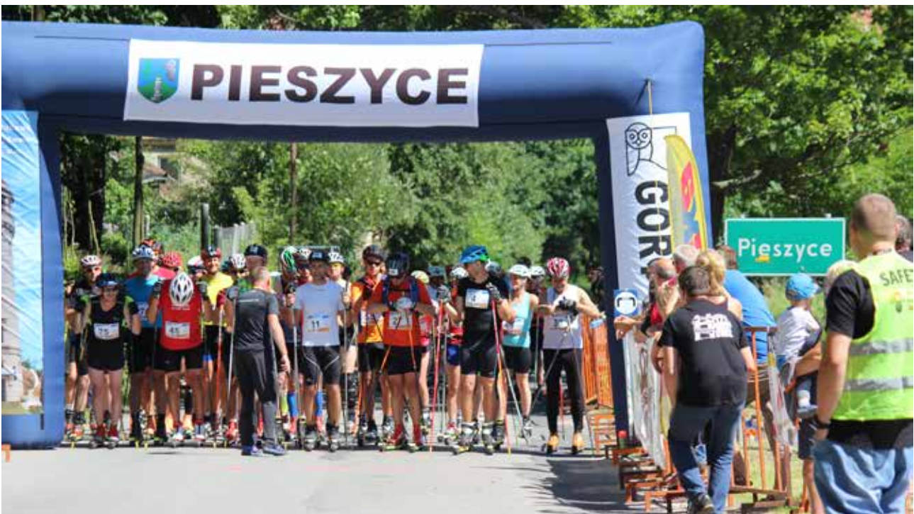
UpHill Gór Sowich