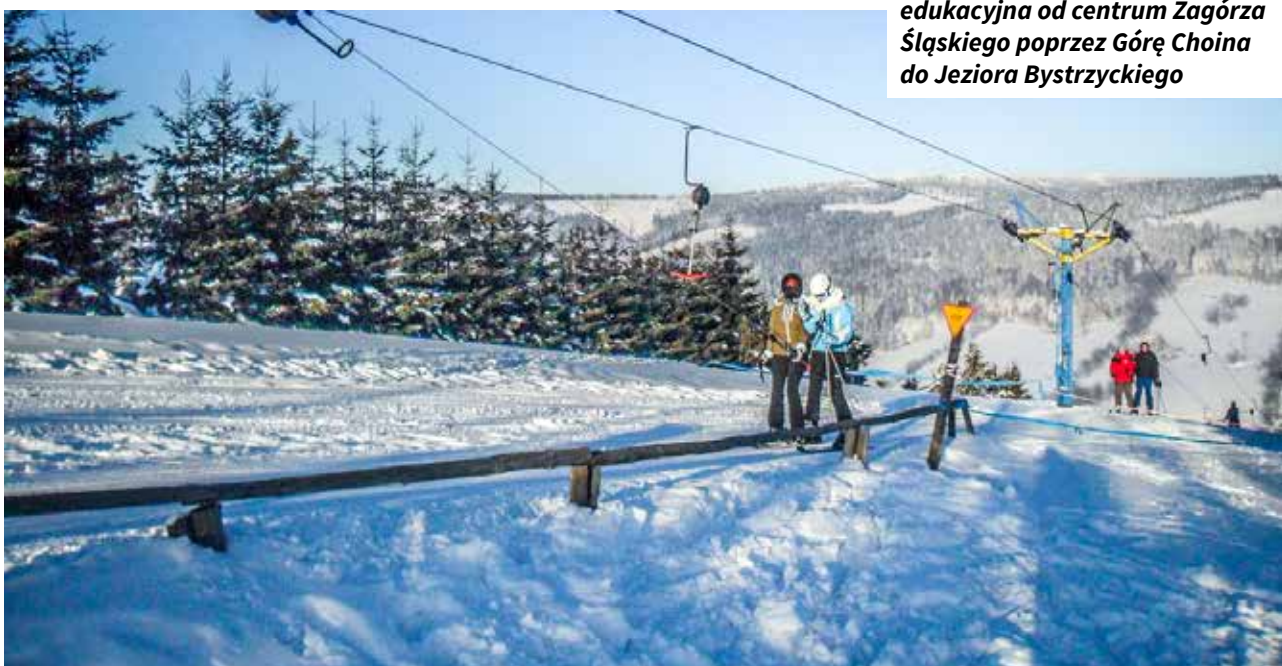
Pokrywa śnieżna zalegająca od grudnia do marca sprzyja uprawianiu narciarstwa zjazdowego na stokach w miejscowości Rzeczka