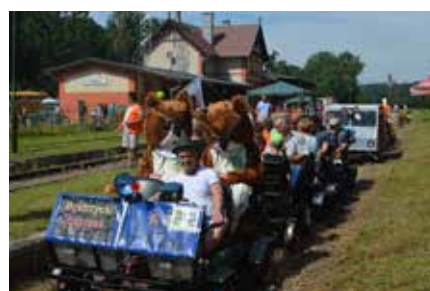
Mistrzostwa Polski w Dreżynowaniu