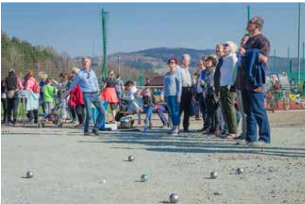
Gra w bule

Active Jedlina to obiekt przy ul. Kłodzkiej, na terenie którego znajduje się skatepark, 2 boiska sportowe, ścieżka pieszo-rowerowa, boiska do gry w petanque oraz bieżnia. Na terenie Active Jedlina corocznie odbywają się imprezy sportowe, tj. Półmaraton Górski Jedlina-Zdrój, Festiwal Aktywności, Międzynarodowy Festiwal Petanque, Międzynarodowy Turniej Piłki Nożnej Dzieci, Uzdrawiskowe Wędrowki, cykle spotkań biegowych dla dzieci i młodzieży oraz wiele innych mniejszych wydarzeń. To również miejsce relaksu przy zbiorniku wodnym, na wygodnych stałych leżakach z widokiem na Góry Wałbrzyskie.