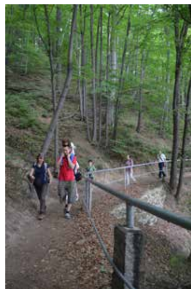
Na uwagę zasługują ścieżka edukacyjna od centrum Zagórzcu Śląskiego poprzez Górę Choina do Jeziora Bystrzyckiego