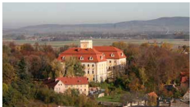
Pałac w Pieszycach